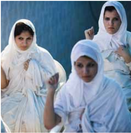
Arriba: Novias sabeas y mandeas participan en un ritual de boda en las orillas del río Tigris, Bagdad, Irak.