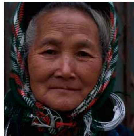
A gauche : Un homme d'Adivasi et son fils dans le village de Kankasarpa, l'état d'Odisha, Inde.

La campagne de l'iSEE a déjà livré quelques résultats positifs. Les médias – y compris les journaux lus par les responsables politiques à l'Assemblée Nationale – ont commencé à exposer des stéréotypes négatifs et à couvrir des questions relatives à l'identité culturelle et à la perte de la langue. Mais Thao est réaliste sur l'impact immédiat : « Bien que les actions concrètes n'aient pas été réalisées, avec la Déclaration comme document de support, la voix des communautés minoritaires a atteint les plus hauts responsables politiques. »