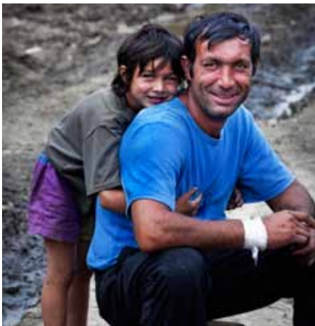
Au-dessus : Un père Rom et son fils se reposent après avoir cueilli des cèpes dans une forêt sur les montagnes d'Apuseni, Roumanie.