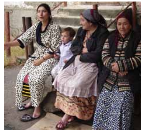
A droite : Femmes Roms en Moldavie.