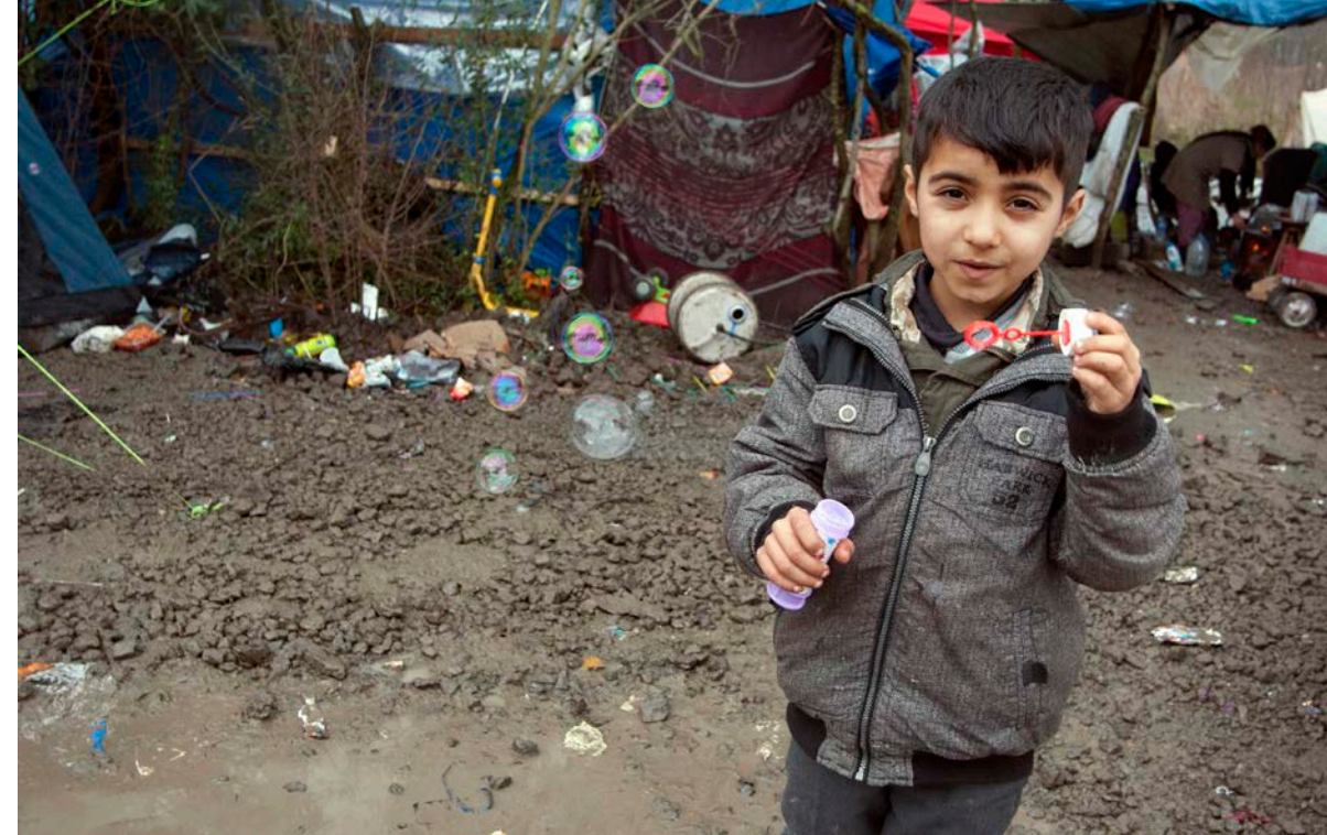
Chlapec robí bubliny v tábore neďaleko francúzskeho Dunkirku. Tábor obývajú predovšetkým kurdskí žiadatelia o azyl.

Výzvy však stoja aj pred tými, ktorým sa napokon podarí dosiahnuť plánovanej destinácie. Napríklad v Európe, kam pred konfliktmi a marginalizáciou utiekli milióny ľudí z Afriky, Ázie či Blízkeho východu a kde sú dnes „hostami“, sa diskusia opakovane zameriava na počet doterajších príchodov, rozsah podpory, ktorá by mala byť prichádzajúcim poskytnutá, či ako by mali byť rozdelení naprieč svetadielom, ak teda vôbec. Táto línia myslenia, čoraz viac ovládaná hlasmi politickej pravice, sa zvyčajne zameriava na kvóty, hranice, obmedzenia a podobne. Avšak pohľad na vysoký počet utečencov a migrantov v Európe ako na skupinu, ktorá bude pravdepodobne v dohľadnej budúcnosti predstavovať významnú menšinu, prináša aj rôzne iné otázky. Akým výzvam budú čeliť pri snahe stať sa akceptovanou súčasťou spoločnosti? Ako sa im v tom dá pomôcť? A aké zdroje a nástroje, od bývania a jazykových kurzov, až po vzdelávanie a poradenstvo, sú potrebné k dosiahnutiu tohto cieľa?