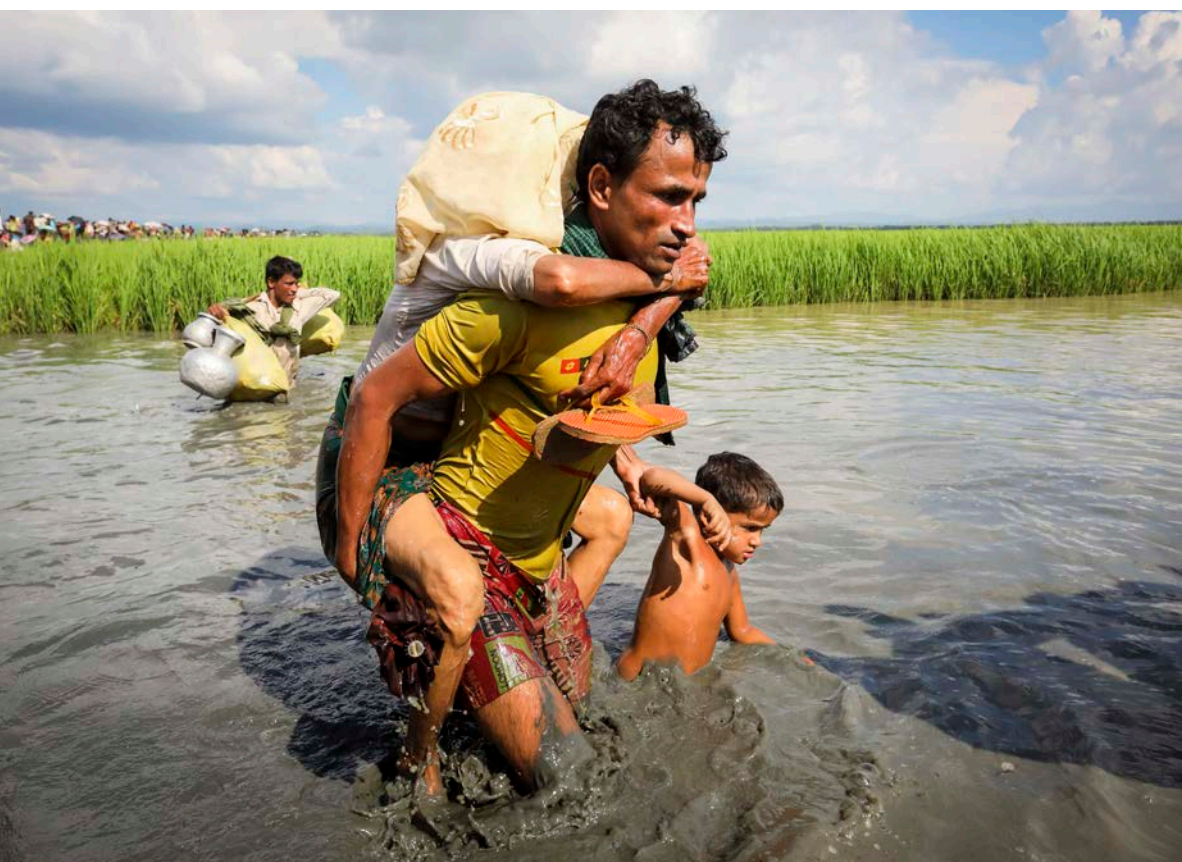
Rohingskí utečenci sa brodia vodným kanálom pri úteku z Mjanmarska do Bangladéša.

K migrácii, ktorá je neodmysliteľnou súčasťou našej éry, prispievajú mnohé faktory, medzi nimi napríklad konflikty, urbanizácia, zmena klímy, globalizácia a mnohé ďalšie. No v rámci toho, ako sa stovky miliónov ľudí presúvajú medzi rôznymi mestami, krajinami a kontinentmi, v rámci tohto širšieho procesu, sa dá nájsť aj čosi iné. Osobitá skúsenosť, ktorá dokáže ovplyvňovať a formovať každý jeden kúsok cesty migrujúcich ľudí. Tou skúsenosťou je ich menšinová príslušnosť.