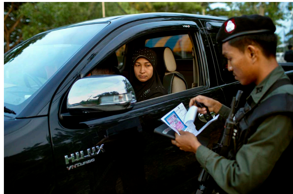
Thajský policajt kontroluje doklady moslimskej žene na checkpointe v Pattani na samom juhu krajiny.

V juhovýchodnej Ázii viedol rapídny rozvoj a využívanie prírodných zdrojov k presídleniu mnohých pôvodných obyvateľov, s mnohými spoločenstvami v Kambodži, Laose a Vietname vysťahovanými pri budovaní vodných elektrární na rieke Mekong. Devastáciu životného prostredia, od ktorého tieto komunity závisia, umožňujú bezzubé politiky, korupcia a zakorenená diskriminácia. V Indonézii, kde sa celé plochy pôvodných lesov stávajú obeťou drevospracujúceho priemyslu, výstavby plantáží palmy olejnej či ťažobných spoločností, je jedným z prispievajúcich faktorov chýbajúce právne postavenie pôvodného obyvateľstva – len veľmi malý zlomok z miliónov hektárov pôdy, ktoré tieto komunity v rámci zvykového práva vlastnili a spravovali, bol aj právne uznaný za ich. Nádej dávajú opatrenia prezidenta Joko Widodoa, ktorý podporuje transfer pôdy pôvodných obyvateľov do ich rúk, čo môže v budúcnosti pomôcť zastaviť aktuálnu vlnu klčovania lesov a vysťahovávaní tamojších obyvateľov.