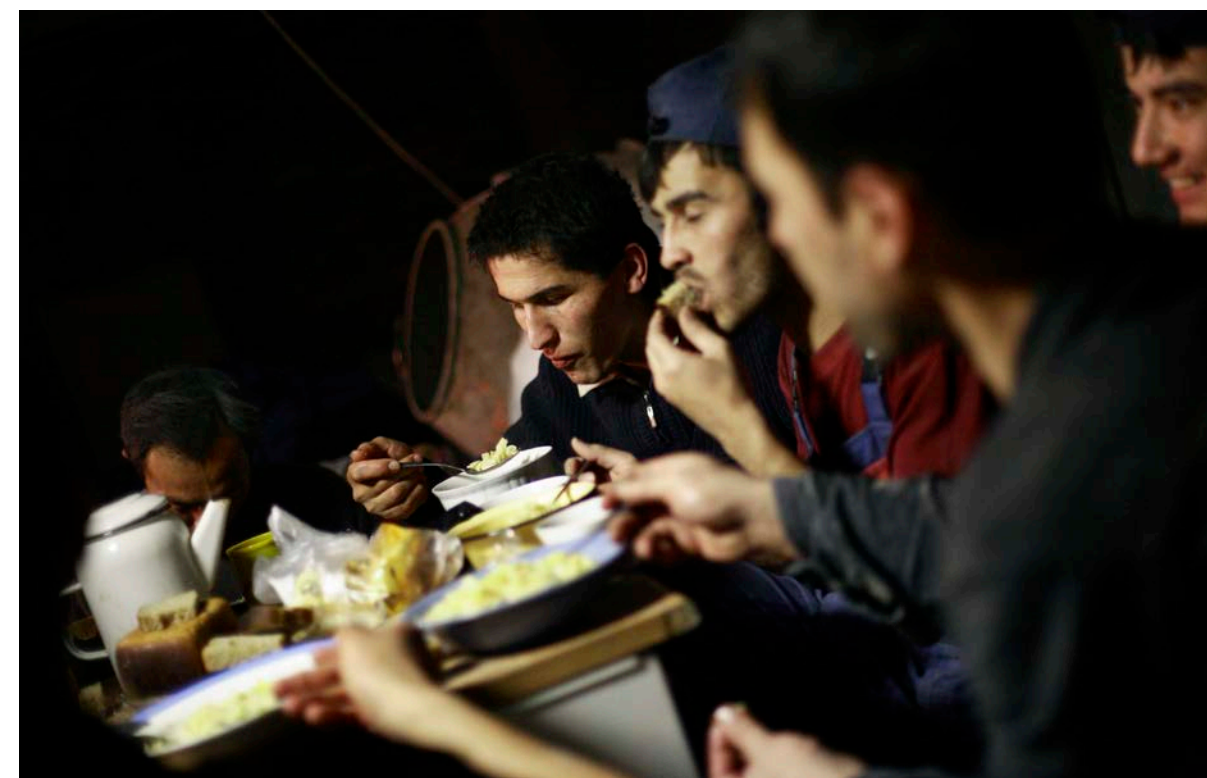
Migrujúci pracovníci z Uzbekistanu pri jedle v ich dočasných príbytkoch na stavenisku v Moskve.