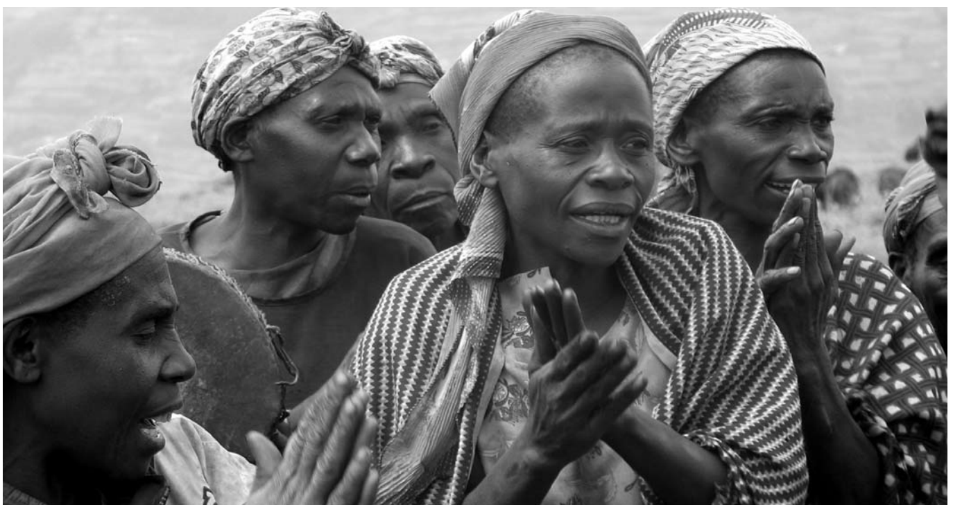
FEMMES BATWA EN OUGANDA.

MRG a travaillé avec les partenaires de l'organisation non gouvernementale (ONG) batwa afin d'établir des zones d'une importance particulière et de souligner la nécessité de données officielles plus complètes, dans le but d'informer les programmes et les politiques de sensibilisation. Les enquêtes, uniques, menées dans quatre pays, bien qu'à une petite échelle, identifient et analysent quelques-uns des problèmes auxquels les femmes et les filles batwa sont confrontées, tels qu'ils sont véhiculés par les communautés batwa elles-mêmes. En particulier, les enquêtes se concentrent sur le manque d'accès à l'instruction et sur l'inquiétante proportion des violences fondées sur la spécificité sexuelle faites aux femmes.