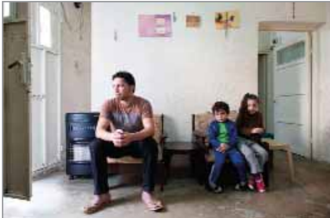
عائلة مسيحية مغتربة في الأردن. ماثيو (على اليسار، ليس اسمه الحقيقي) كان قد أُختطف من قبل أفراد من تنظيم داعش عندما رفض التخلي عن إيمانه.

إن قلق الحماية أيضاً له تأثير كبير على تدفقات الهجرة. إن هجرة النساء الأيزيديات اللواتي هربن من قبضة تنظيم داعش هن مثال واحد على ذلك. ومن الجدير بالذكر، لقد ألمح نشطاء إلى أن عديداً من النساء الأيزيديات أُجبرنَ على مغادرة العراق من قبل أسرهم،