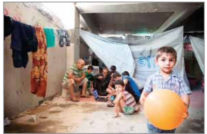
أطفال أيزيدية في مخيم في زاخو، العراق، بالقرب من الحدود التركية. جيف غاردنر.

إن السكان النازحين في العراق ينبعون من 8 محافظات من أصل 18 محافظة في البلاد، على الرغم من أن غالبية النازحين يأتون