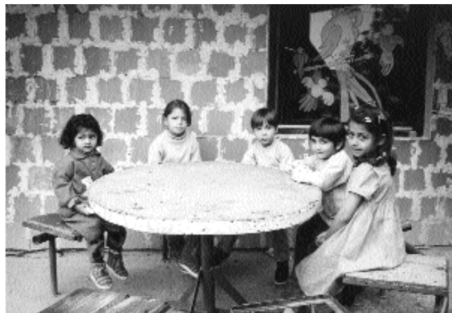
Romska deca u osnovnoj školi u blizini Beograda, Srbija.

U Nišu, gde su školske 1998/99. godine romska deca imala koristi od dvojezičnog obrazovanja u kulturno osetljivom zabavištu, studija Fonda za otvoreno društvo